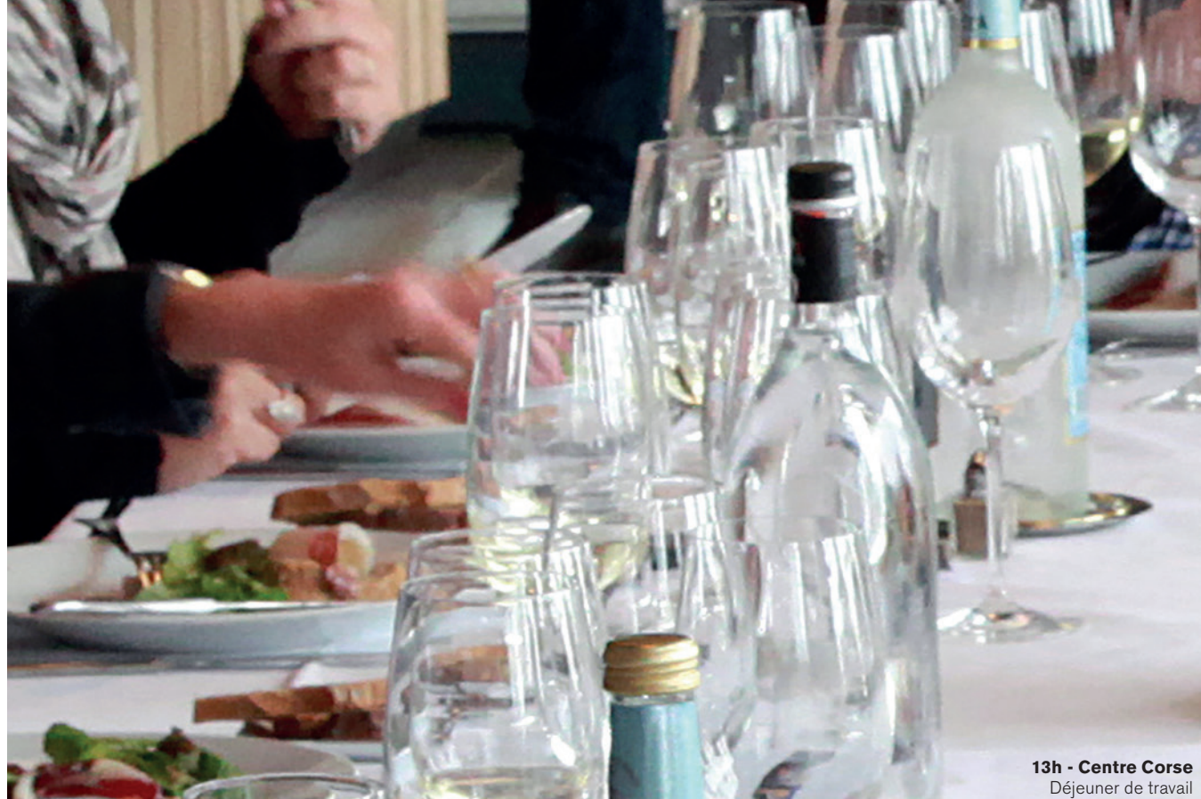
13h - Centre Corse Déjeuner de travail dans un établissement de caractère.

d'île verte en Méditerranée. Parce qu'elle est à la fois sauvage, accueillante et préservée, empreinte d'une forte identité, la Corse est un lieu unique qui génère les émotions les plus fortes créant de vraies surprises et des rencontres humaines qui marqueront le déroulement des séjours affaires. Profitez des atouts de ce territoire qui saura répondre au mieux aux exigences et ambitions des organisateurs et des participants avec de belles émotions en perspective !