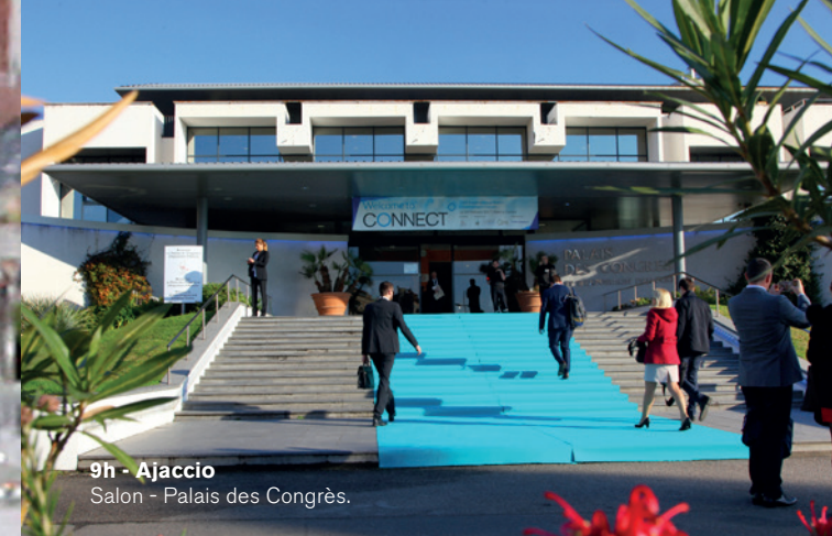
9h - Ajaccio Salon - Palais des Congrès.