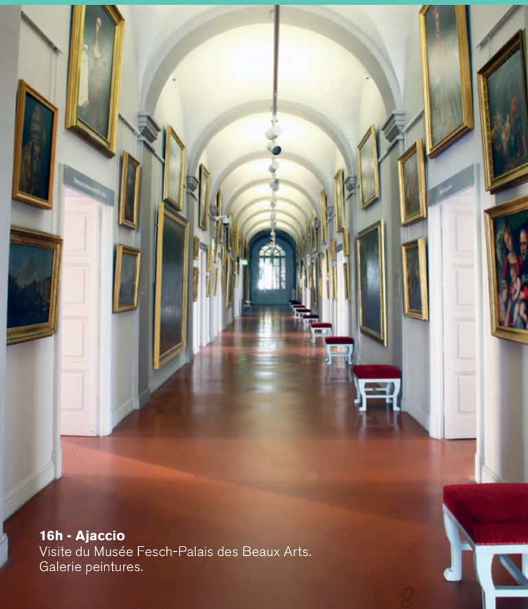
16h - Ajaccio Visite du Musée Fesch-Palais des Beaux Arts. Galerie peintures.

Privatisez un espace pour des cours d'œnologie dispensés par des sommeliers insulaires qui vous transmettront leur passion et sauront animer tout type d'événement.