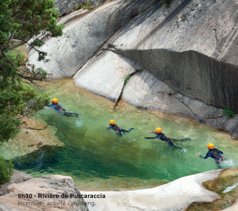
9h30 - Rivière de Purcaraccia Incentive - activité canyoning.