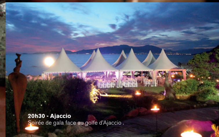
20h30 - Ajaccio Soirée de gala face au golfe d'Ajaccio.