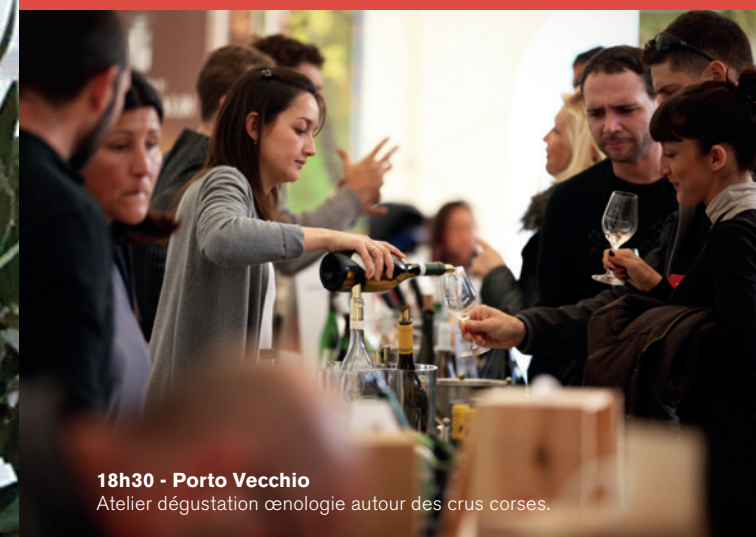
18h30 - Porto Vecchio Atelier dégustation œnologie autour des crus corses.